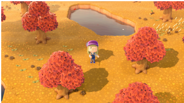
Mais parfois les guêpes finissent par te rattraper - Une piqûre de guêpe sur Animal Crossing

Pour développer ce sujet, il faut d'abord savoir qu'un terrain propice à une addiction est celui d'un cerveau qui veut échapper inconsciemment à un ou des problème(s).