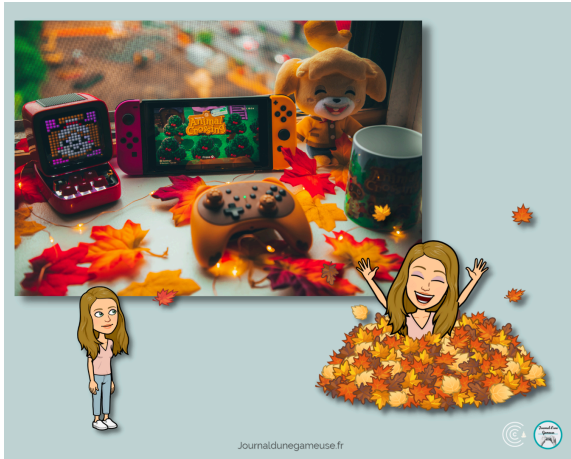
J'ai démarré le jeu Animal Crossing en automne

Donc, en bon jeu de simulation, ici, tout se passe en temps réel . Cela veut dire que le jeu évolue selon la date et l'heure de la vraie vie. Les saisons également : en automne vous aurez des feuilles qui tombent et les couleurs chaudes, en hiver vous aurez de la neige et au printemps une allure verdoyante et fleurie.